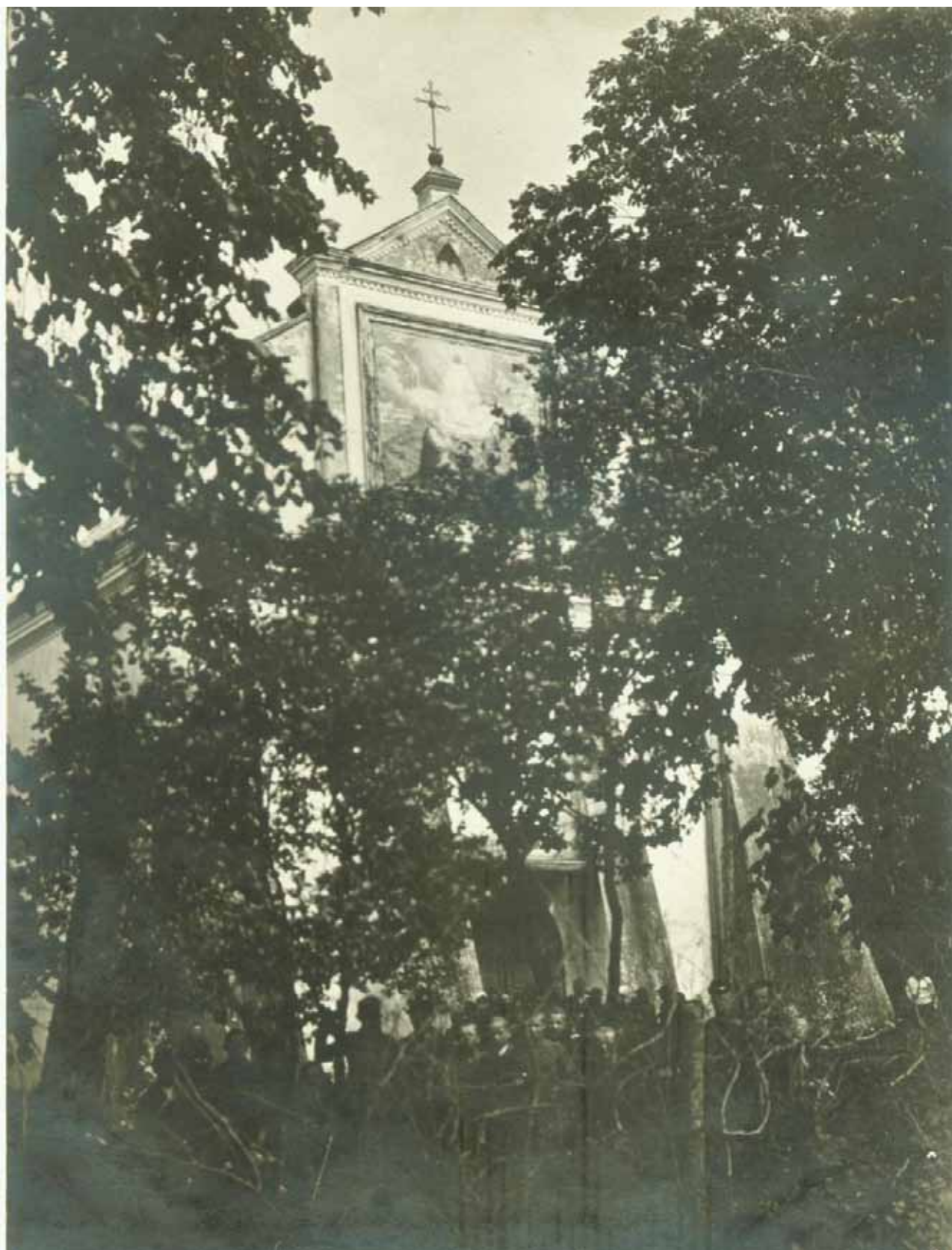
Wycieczka przed głównym wejściem do kościoła w Podgórzu w dniu 27 maja 1926 roku.