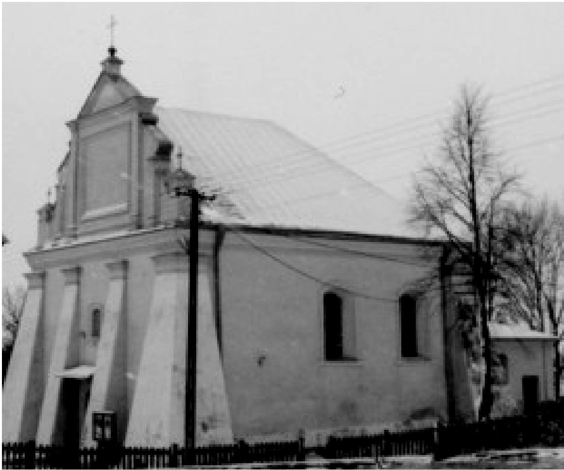
Po latach kościół w Podgórzu ale już bez obrazu olejnego na frontonie świątyni.