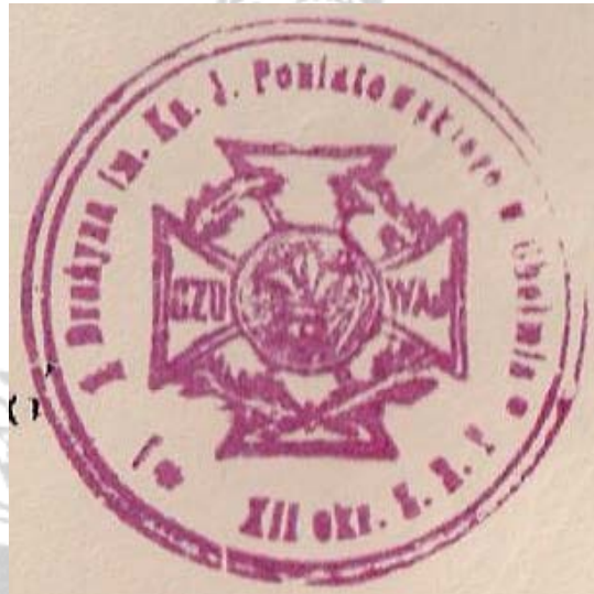
Odcisk pieczęci I Chełmskiej Drużyny Harcerzy im księcia Józefa Poniatowskiego.

Od marca 1917 do początkowych miesięcy roku 1930 I Chełmska drużyna Harcerzy im. księcia Józefa Poniatowskiego występowała w czasie świąt państwowych, szkolnych i harcerskich ze swoimi symbolami – proporczykami. 1 Powoli krystalizowała się myśl o sztandarze dla tej znanej i zasłużonej drużyny.