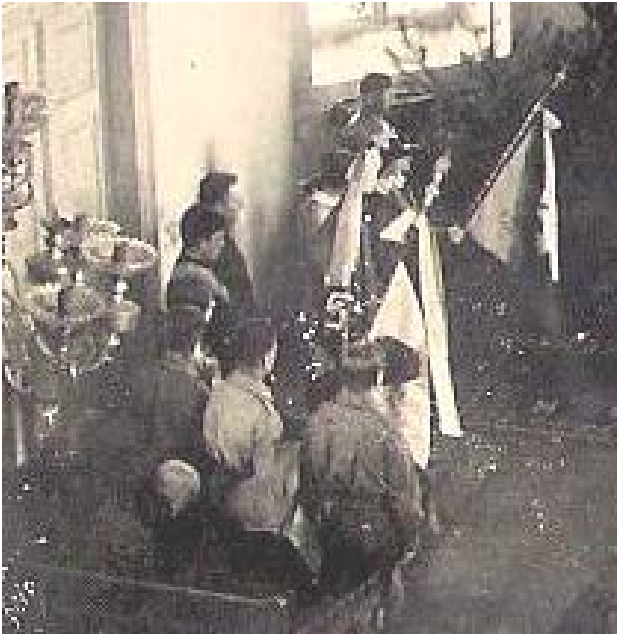
Powiększony wycinek z poprzedniej fotografii eksponujący poczty sztandarowe we wspomnianej uroczystości