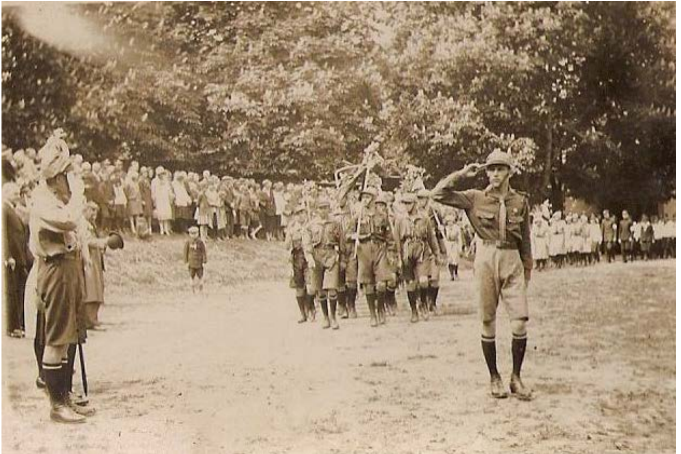
Na pierwszym planie defiluje I Chełmska Drużyna Harcerzy im. księcia Józefa Poniatowskiego z proporcem drużyny i proporcami zastępów. Święto szkolne w Gimnazjum Państwowym im. Stefana Czarnieckiego. Chełm 1927r.