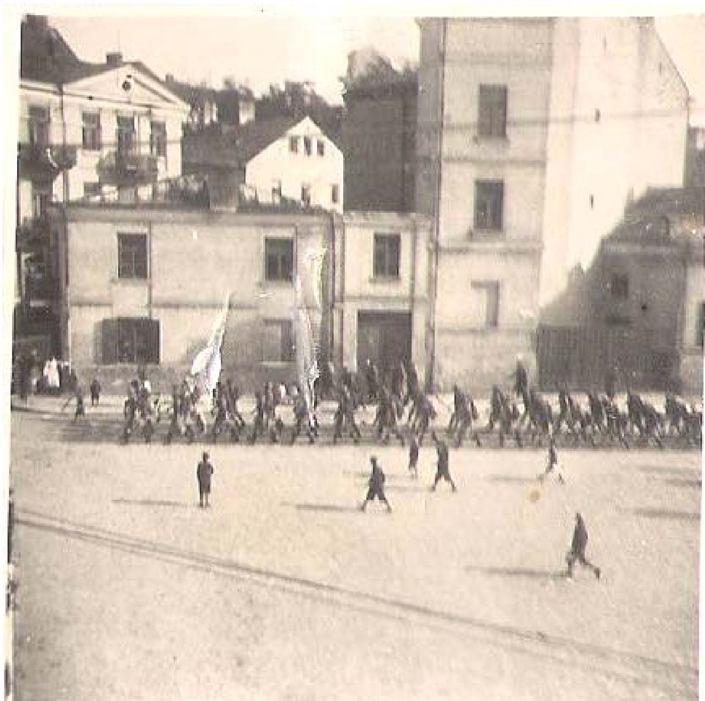
Plac Świętego Ducha w Chełmie. Święto Hufca Chełm. Na uroczysty przegląd wkracza I Chełmska Drużyna Harcerzy im. księcia Józefa Poniatowskiego