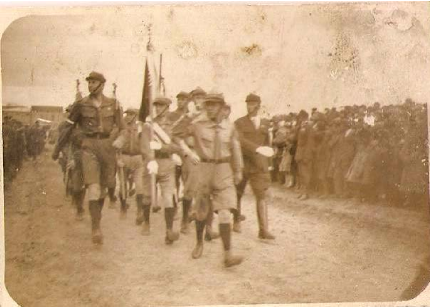
Uroczystość państwowa. Na pierwszym planie poczet sztandarowy I Chełmskiej Drużyny Harcerzy im. księcia Józefa Poniatowskiego.