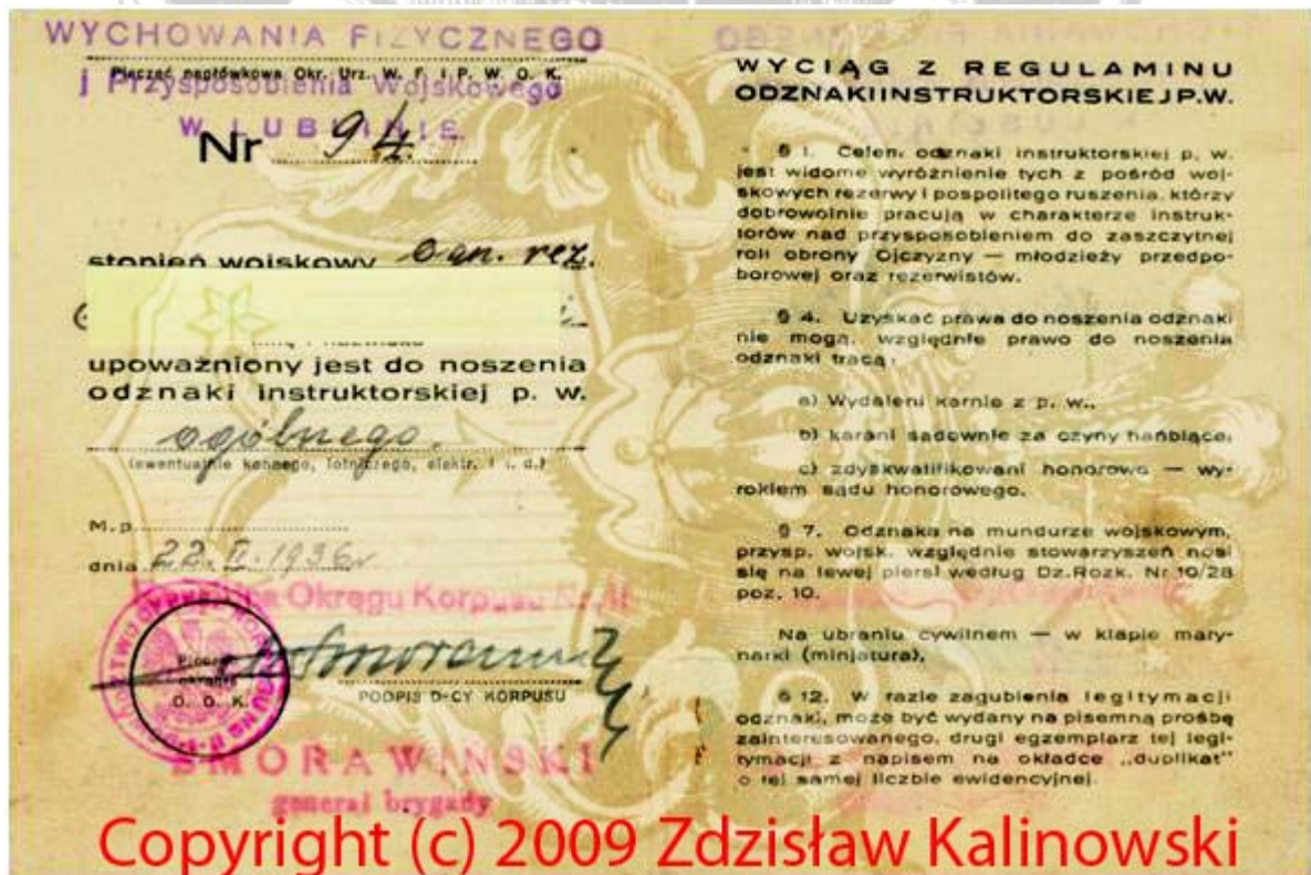
Legitymacja instruktora P.W.

W roku 1930 w gminie Rejowiec najprężniej działały Związki Strzeleckie „ Strzelec „ w następujących miejscowościach : Aleksandrii Niedziałowskiej , Kobylem , Wólce Rejowieckiej ,