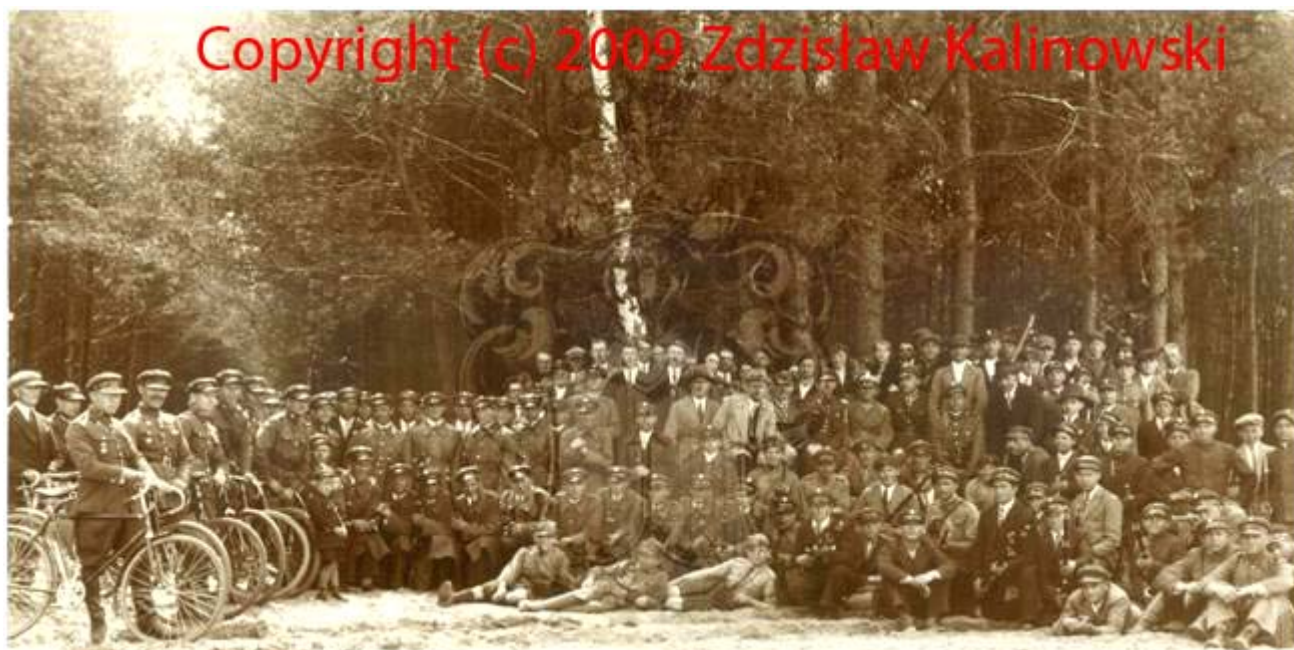
Koncentracja oddziałów Związku Strzeleckiego. Las Hruszów k / Rejowca . Maj 1933 rok .

W pracach wychowawczych i w zdobywaniu postawy obywatelskiej pomagały biblioteki i świetlice .Przysposobienie Wojskowe miało za cel zwiększenie stałej gotowości społeczeństwa do obrony kraju.