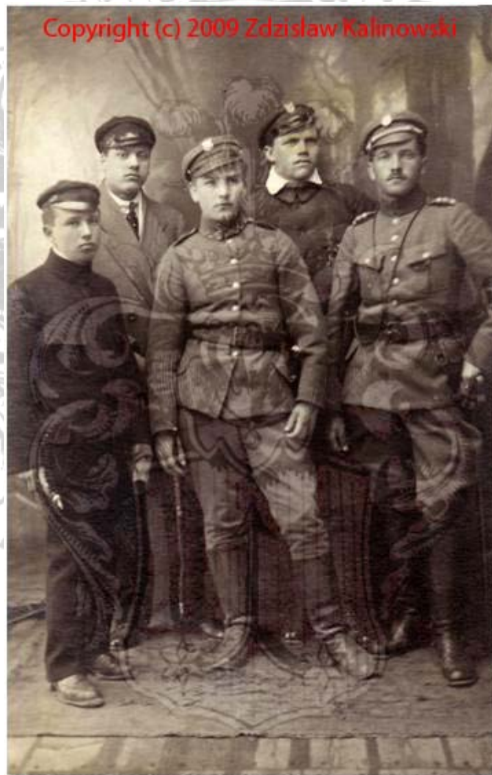
Młodzież rejowiecka z organizacji „ Strzelec,, z Obywatелеm Instruktorem ( pierwszy z prawej )

Dzięki propagowaniu przez Z.S. sportu strzeleckiego i jego atrakcyjności powiększa się liczba członków Związku . Każdy kandydat na członka Związku przechodzi okres próbny, w czasie, którego oprócz udziału w zajęciach poznaje historię Związku Strzeleckiego, życie i działalność Józefa Piłsudskiego oraz statut i regulaminy. Po okresie próbnym, zakończonym egzaminem składa przyrzeczenie w wyznaczonym terminie. Przyrzeczenia strzeleckie odbywały się dwa razy w roku : 3 Maja i 11 Listopada. Po złożeniu przyrzeczenia, kandydat otrzymywał książeczkę strzelecką.