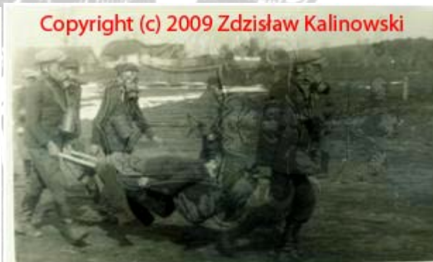
Uczniowie klasy VII ćwiczą umiejętności w niesieniu pomocy w ramach drużyny ratowniczo-sanitarnej.