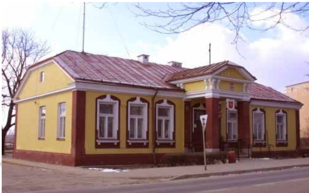
Budynek Urzędu Gminy w Rejowcu, który został wzniesiony po 1908 roku 3 . Stan współczesny.

stacja poczt, apteka, fabryka wyrobów z miedzi, dwie gorzelnie, olejarnie, 6 jarmarków.