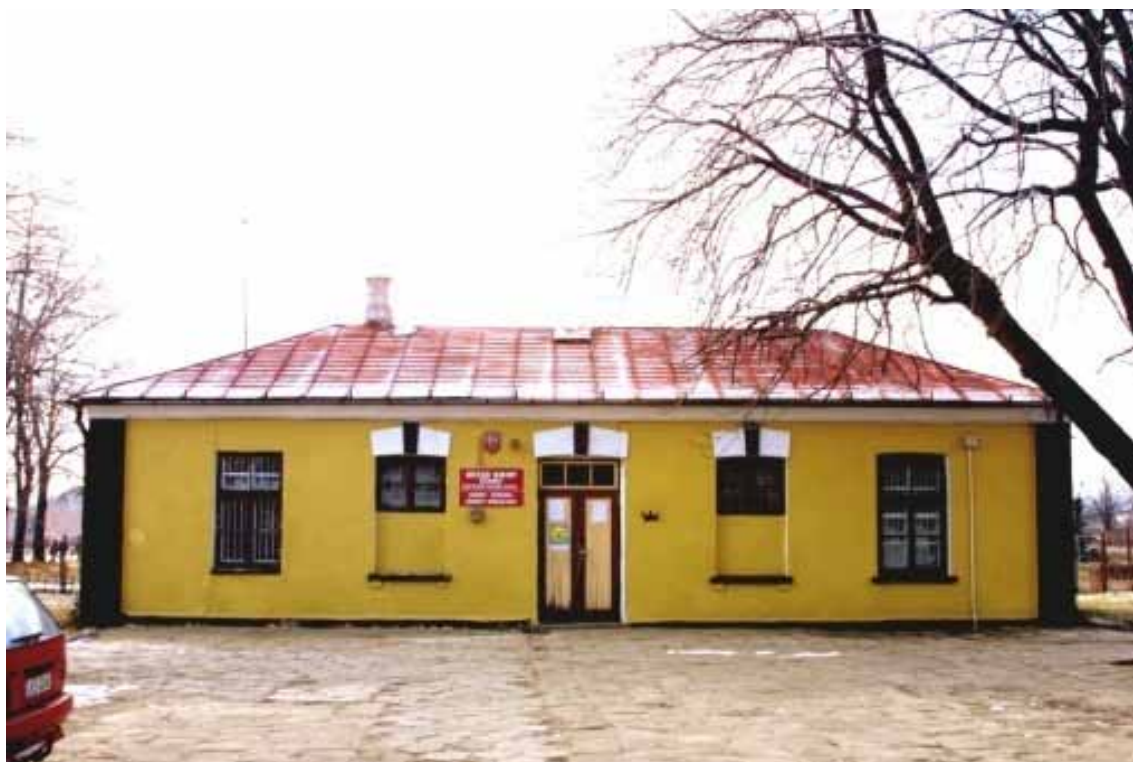
Budynek aresztu przy Sądzie Pokoju w Rejowcu. Oslawiona „Koza”, rejowiecka.

Pomieszczenia aresztu Sądu Pokoju przy gminie Rejowiec były przeznaczone: większa sala dla mężczyzn a mniejsza dla kobiet. Pośrodku były dwie izby mieszkalne dla dozorczy aresztu.