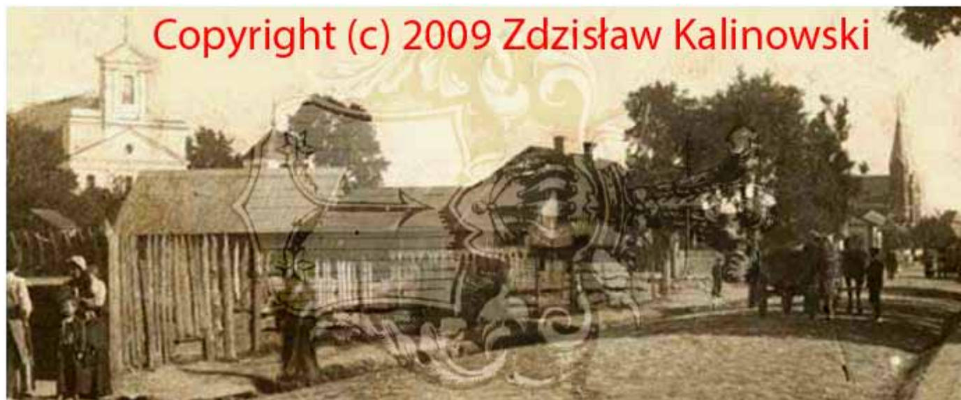
Wycinek fotografii. Obecnie ul. Tadeusza Kościuszki. Rok 1908. Po prawej stronie kościół po unicki. W głębi kościół rzymskokatolicki oraz wiatrak.