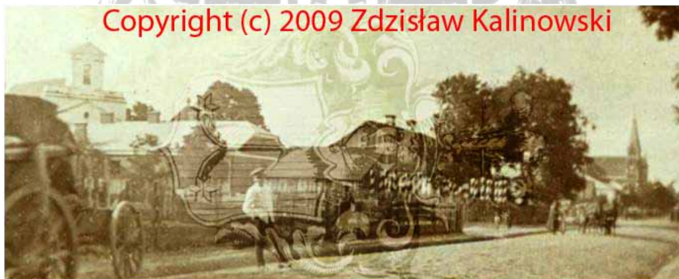
Wycinek fotografii. Obecnie ul. Tadeusza Kościuszki. Rok 1913. Po prawej stronie zabudowania Urzędu gminy, kościół po unicki. W głębi kościół rzymskokatolicki oraz wiatrak.

Na przełomie XIX i XX wieku Ziemia Chełmska nazywana była przez zaborców kontrowersyjną moim zdaniem nazwą „ Chełmszczyzna ”. W roku 1912 rosyjscy zaborcy tworzą w Chełmie nową gubernię, która pomiędzy 1 a 14 wrześniem 1913 roku rozpoczyna swoje formalne funkcjonowanie. Do guberni chełmskiej zostało włączonych osiem powiatów wschodnich z guberni lubelskiej i siedleckiej.. W granicach guberni chełmskiej Rejowiec pozostał do dnia 10 sierpnia 1915 roku. Jest to praktycznie data końca zaboru rosyjskiego. W ówczesnym nazewnictwie na czele powiatu ( ujezdu) stał – naczelnik, gminy ( wołosti) – wójt, gromady- sołtys.