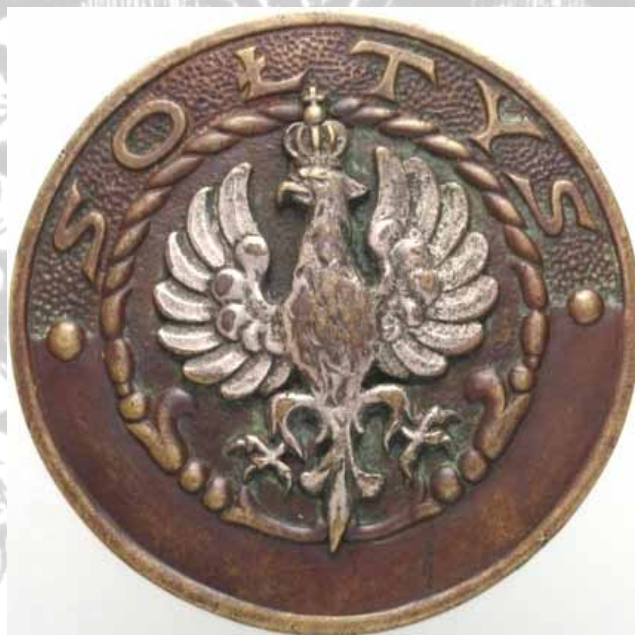
Odznaka soltyisa z archiwum domowego autora. Wykonana w zakładzie BR. Łopieńscy. Warszawa.

Poniżej prezentowane fotografie pochodzą z prywatnego archiwum autora. Są to liczne zdjęcia dokumentacyjno- porównawczych Rejowca ( te same ujęcia kadrowane w odstępach kilku letnich lub wtedy, gdy następowała wyraźna zmiana w konfiguracji fotografowanych ujęć.