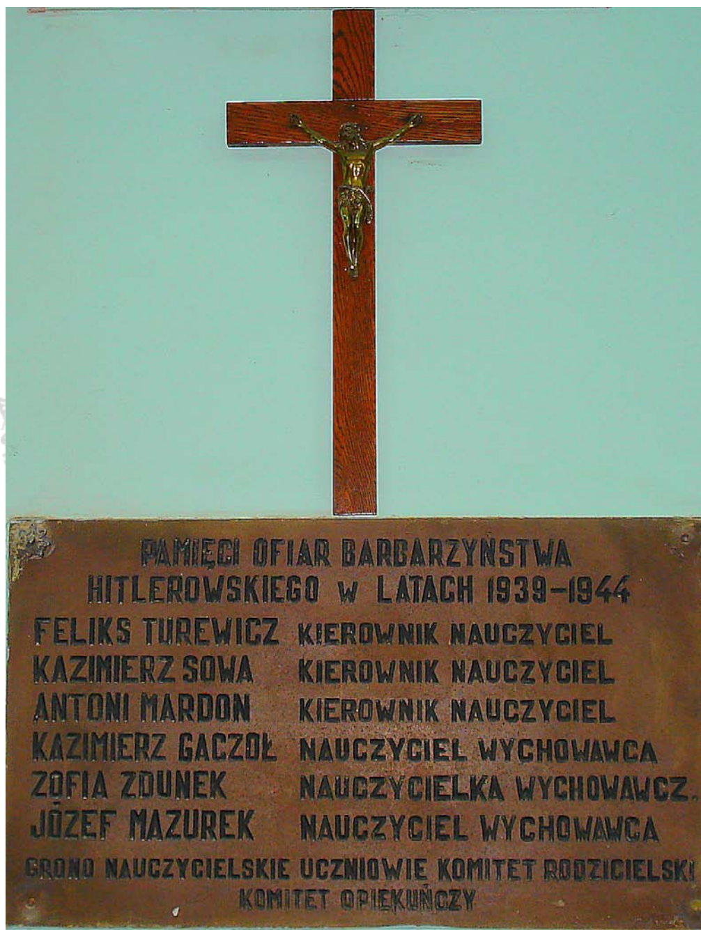
Tablica pamiątkowa na korytarzu parteru Szkoły Podstawowej im. Mikołaja Reja w Rejowcu , która zawiera wiele błędnych określeń , nieścisłości i zafałszowuje historię.