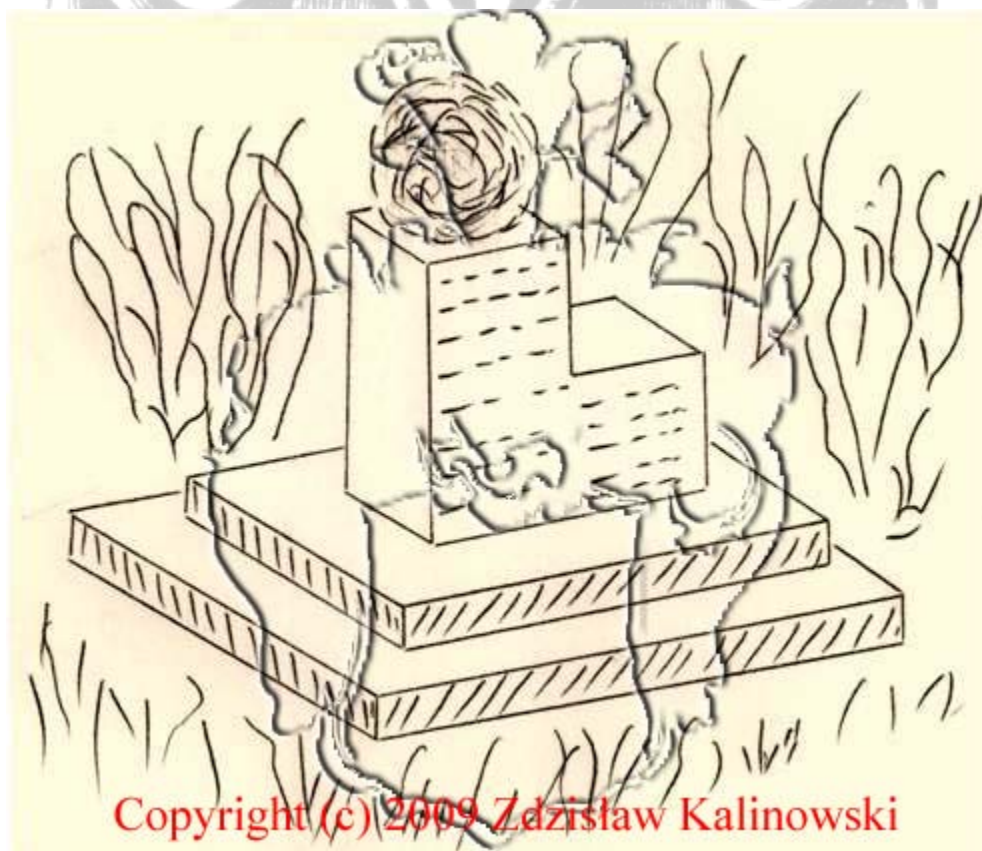
Szkic projektu pomnika przed szkołą do realizacji .

Po zakończeniu działań II wojny światowej społeczeństwo Rejowca wraz z uczniami i nauczycielami szkoły w Rejowcu upamiętniło pomordowanych pedagogów fundując wolnostojący pomnik przed szkołą . Na którym były wypisane nazwiska straconych ,