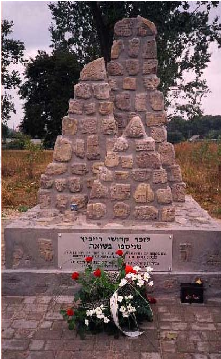
Symboliczny pomnik pamięci ofiarom zagłady wykonany z kawałków rozbitych macew . Uroczyste odsłonięty 19 sierpnia 2003 roku. .