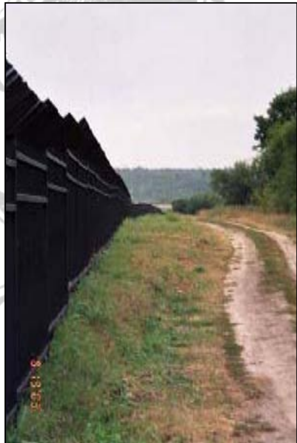
Ogrodzenie cmentarza wykonano w 2002 roku .