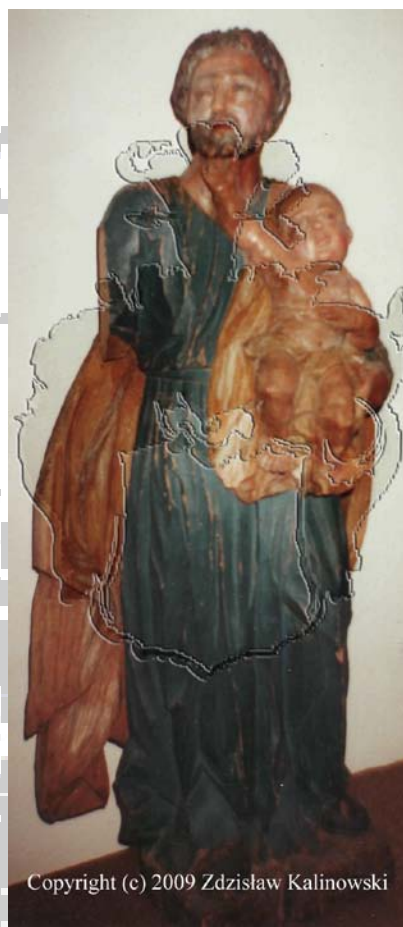
Figura wykonana w drewnie lipowym ze zburzonej kapliczki przedstawiająca świętego Józefa trzymającego na lewym ręku maleńkiego Jezusa. Rzeźba pochodzi najprawdopodobniej z roku 1875 . Autor nieznany .Rzeźbę wyniesiono ze zburzonej kapliczki

do dnia dzisiejszego u zbiegu ulic Szkolnej i St.Zwierzńskiego (pierwotnie ul.Henryka Dąbrowskiego )