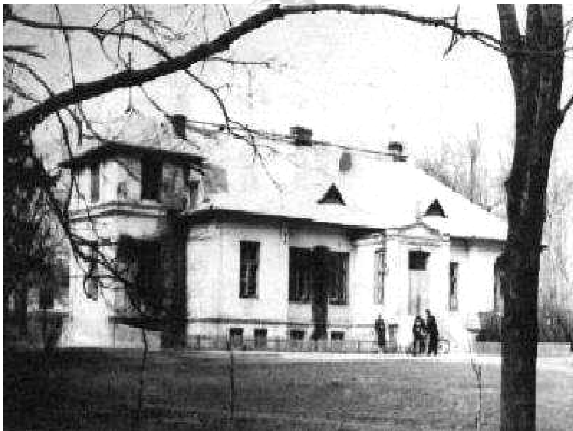
Dwór Morawsko - Kiwerskich 6

W skład tych dóbr wchodziły : Stajne – Polesie , Stajne – Złote 1 , Stajne – Stacja 2 . W dniu 29 sierpnia 1877 roku przez stację Rejowiec przejechał pierwszy pociąg . W 1886 roku dobra Stajne składały się z folwarków : Stajne i Polesie oraz wsie Stajne i Majdan Stajeński , własność Krzysztofa i Eleonory (z Jabłońskich) , W 1890 roku zmarł Krzysztof Morawski 3 . Dobra Stajne przeszły w posiadanie syna Mieczysława , który założył nowy folwark Stajne – Polesie 4 . Otrzymał też folwark Nowiny 5