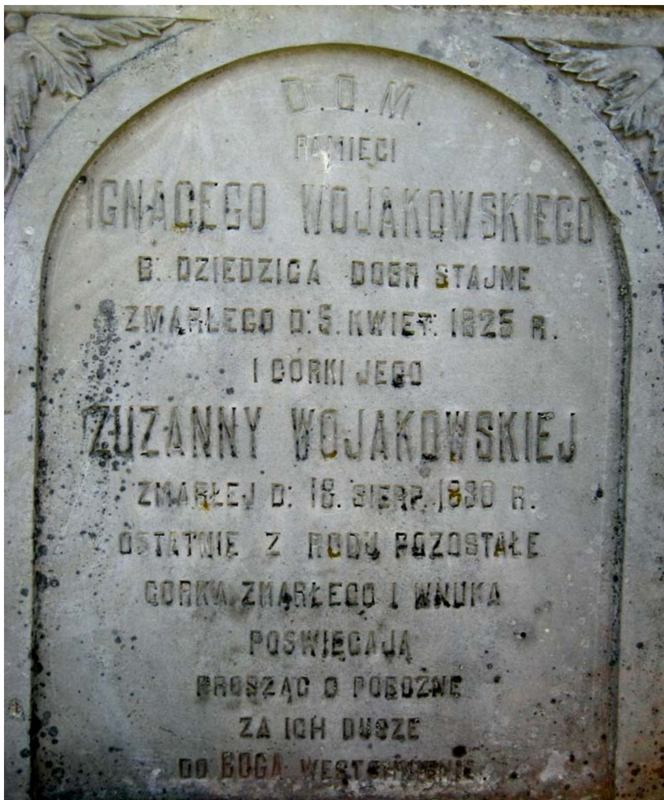
Z pomnika nagrobnego ( cmentarz parafialny w Pawlowie).