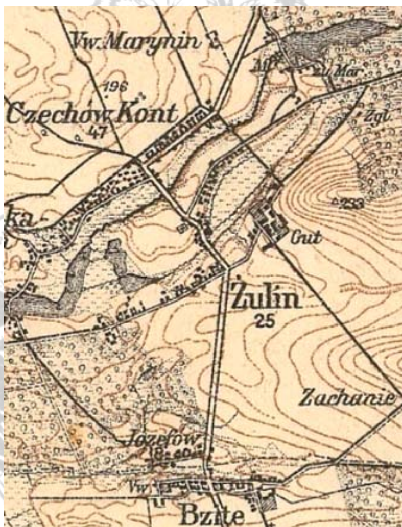
Wycinek z niemieckiej wojskowej mapy sztabowej z 1915 roku .

Żulin , wieś i dobra wchodziły do powiatu chełmskiego nad rzeką Wieprz . Gmina i parafia. Pawłów, oddalona 5 wiorst od Rejowca (stacja drogi żelaznej nadwiślańskiej), a 20 wiorst od Chełma, posiada cerkiew parafialną, szkołę, trzy młyny wodne, fabrykę drożdży prasowanych, krochmalnię, gorzelnię i papiernię wyrabiającą gorsze gatunki papieru. Zakłady fabryczne stanowiły osadę odrębną, zwaną Pomian .