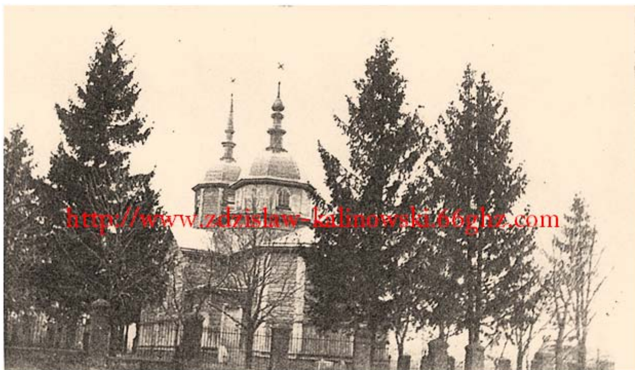
Cerkiew w Żulinie . Prace budowlane prowadzono w latach 1900 – 1906 .Foto z 1939 roku . Żulin.

Funkcję parochów w parafii Żulin pełnili między innymi :