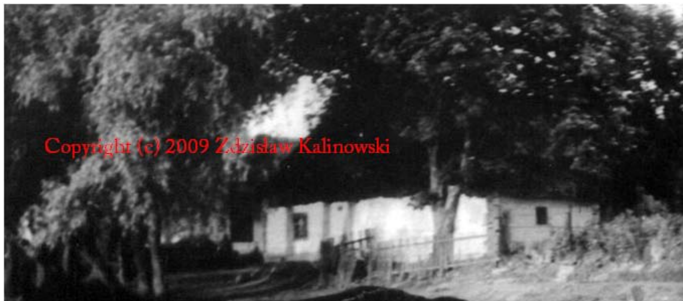
Folwark Stajne – Złote 10 . Zabudowania mieszkalne przy ul Złotej .Foto z 1931 roku.

Rejowiec ( Morawinek – Stajne ) swoją obecną nazwę Rejowiec Fabryczny otrzymał w 1955 roku , a prawo miejskie nadano 22 lipca 1962 roku.