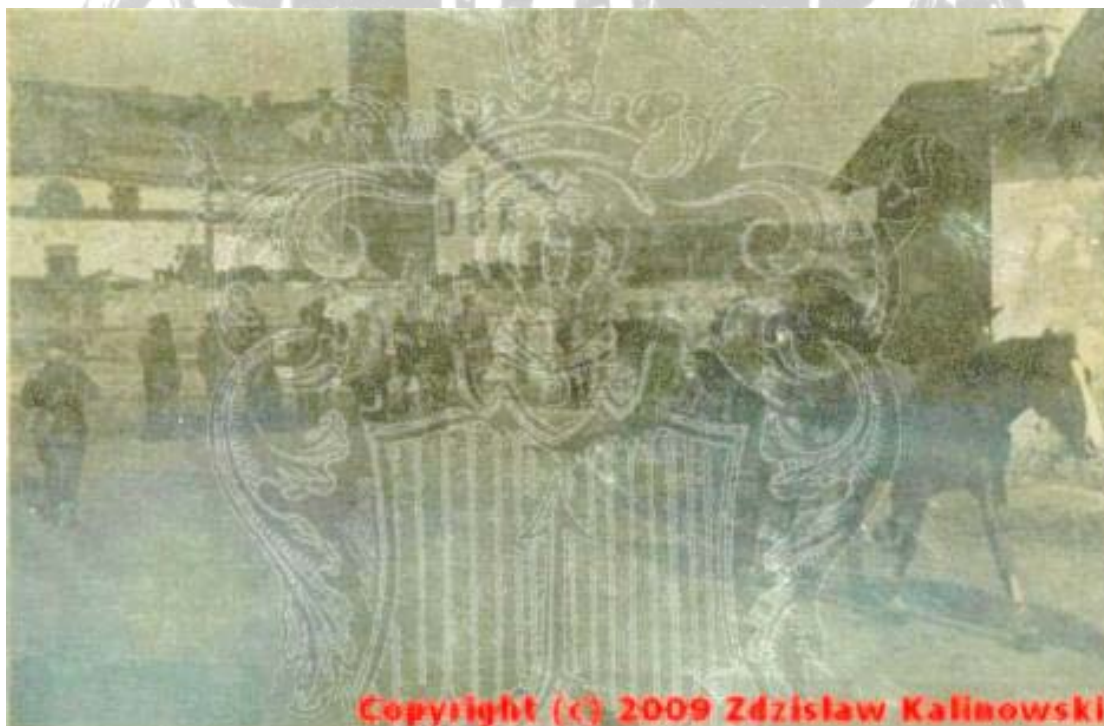
Niemcy na placu Cukrowni Rejowiec. W czasie okupacji kwaterowali w Pałacu Budnego. Po popołudniowaodprawa, przed rozpoczęciem akcji pacyfikacyjnej w Gettcie w Rejowcu. Maj 1942 roku..

Po 17 września 1939 roku Rejowiec na krótko okupują żołnierze Armii Czerwonej. W dniu 10 października 1939 roku Niemcy zajmują pałac na swoje potrzeby. Nowi użytkownicy w latach 1942 — 1944 przeprowadzają zmiany -częściowo przebudowują wnętrze pałacu.