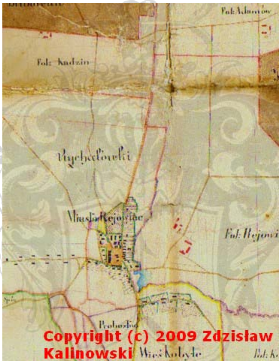
Wycinek z planu wykonanego na potrzeby Woronieckiego przedstawiające miasto Rejowiec i najbliższe okolice.

Kolonia w miejscowości Kobyle powstaje przed rokiem 1864.