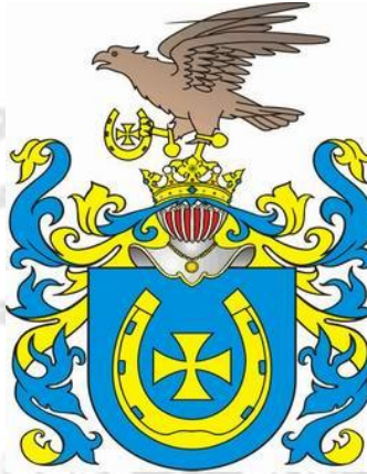
h. JASTRZĘBIEC 1