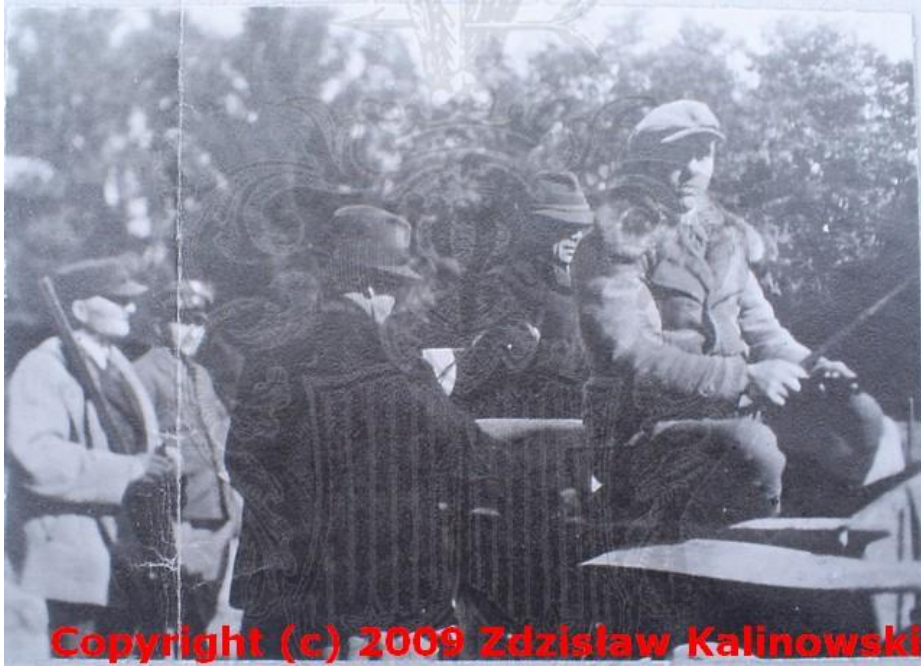
Wyjazd na polowanie do lasów Żulińskich.